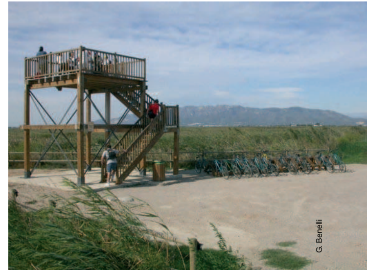
Mirador de L'Embut.