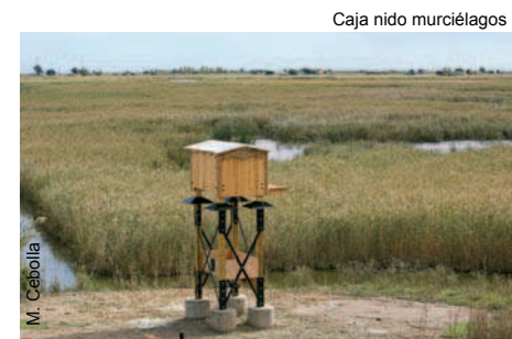
Caja nido murciélagos