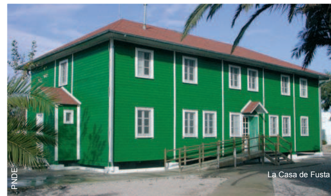
La Casa de Fusta