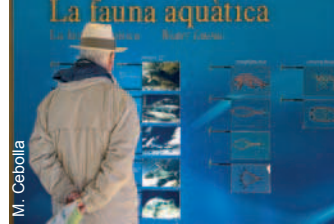
Exposición de la Casa de Fusta

Si decidimos continuar, debemos seguir con mucha precaución por la carretera que une El Poblenou y la Barra del Trabucador (ver sugerencias). A la izquierda nos acompañan los arrozales y la omnipresente garcilla bueyera ( Bubulcus ibis ) buscando alimento, y a la derecha, un poco más lejos, la bahía de Els Alfacs. En el último tramo observamos las antiguas salinas de Sant Antoni y, justo antes de llegar a la playa, nace a la izquierda (km 16,3) una carretera que nos llevará hasta el mirador de La Tancada, desde donde podremos admirar la fauna presente en la laguna, especialmente flamencos ( Phoenicopterus roseus ), ánades reales ( Anas platyrhynchos ) y somormujos lavancos ( Podiceps cristatus ). Es el momento de tomarse un descanso. Seguiremos todo recto durante unos 600 m, hasta encontrar el carril bici que recorre La Tancada. Observamos el cambio de vegetación. Ahora la salicornia ( Arthrocnemum fruticosum ), planta adaptada a suelos salinos, domina el paisaje.