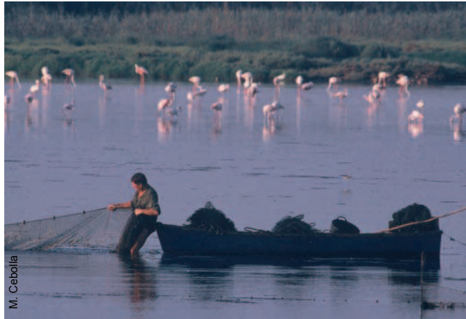
Pescador con trasmallo