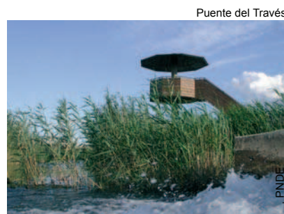
Puente del Través