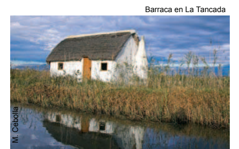
Barraca en La Tancada