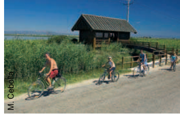
Ciclistas en el mirador de La Tancada