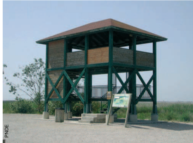
Mirador de la Casa de Fusta

Cuando se acaba el carril (km 21,7), seguimos recto por un camino de uso rural durante un kilómetro hasta encontrar la carretera que transcurre paralela a un gran canal de tierra. Torcemos a la derecha (km 23,2) y al cabo de 700 m encontramos el puente por donde deberemos girar a la izquierda para dirigirnos de vuelta al punto de partida. Antes de llegar, encontramos el mirador de L'Embut (km 24,1), desde donde se observa una magnífica vista de L'Encanyissada; se ven las fochas ( Fulica atra ) y la caja nido para murciélagos más grande de Europa. Podemos contemplar también la Casa de Fusta, situada a 2 km. La distancia total del recorrido es aproximadamente de 26,2 km.