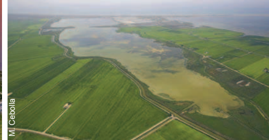
Vista aérea de La Tancada