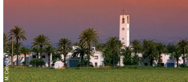
El Poblenou del Delta