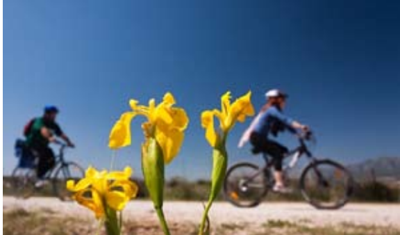
2 Zona Sèquia de Mar

De octubre a febrero, regresamos sobre nuestros pasos para un recorrido total de 25,8 Km. Este itinerario transcurre por caminos rurales (40%) por carril bici (28%) y por carretera (32%). Tierra (68%), asfalto (32%).