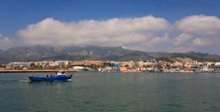
1 Puerto pesquero de Sant Carles de la Ràpita