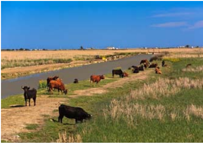
7 Reses en la zona XII

Arrozales: ánade real, garza real, garcilla bueyera, cigüeñuela. Erms Vilacoto: Escribano palustre, buscarla unicolor, zampullín chico, garza imperial, aguilucho lagunero. Encanyissada: flamenco, focha, carrilero común.