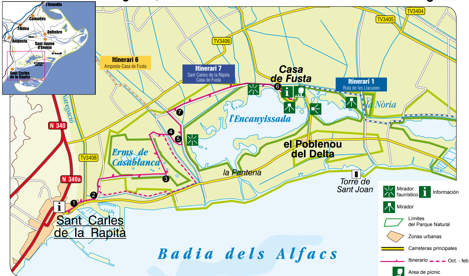
4 En busca de la Encanyissada