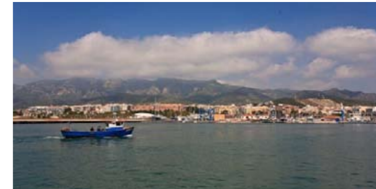
1 Port pesquer de Sant Carles de la Ràpita