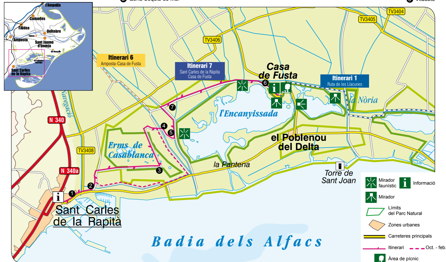
4 En busca de l'Encanyissada