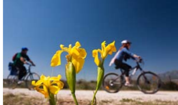
2 Zona Sèquia de Mar

D'octubre a febrer, retornem sobre les nostres passes per a un recorregut total de 25,8 Km. Aquest itinerari transcorre per camins rurals (40%) per carril bici (28%) i per carretera (32%). Terra (68%), asfalt (32%).