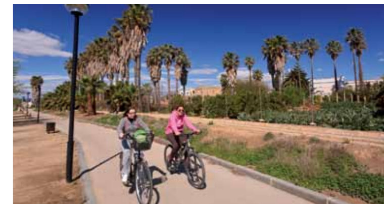
2 Casa de los Belgas