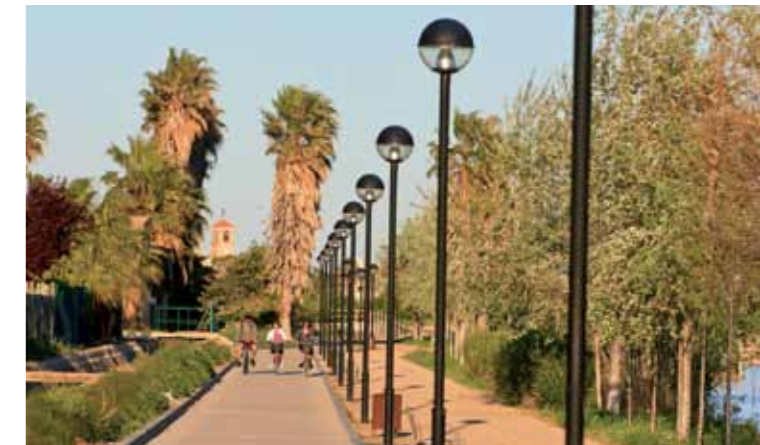
1 Campanario de Jesús y María